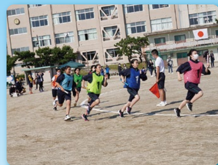
たかこう祭(体育大会)