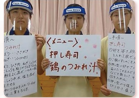
愛知県高校生福祉研究アワードでの発表