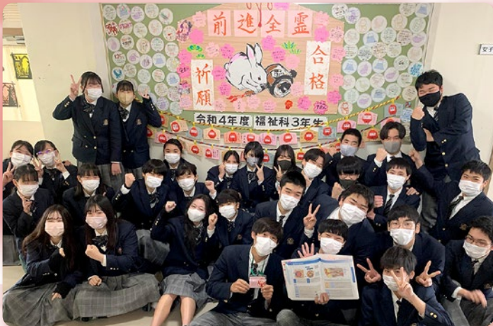
介護福祉士国家試験に向けての応援掲示板