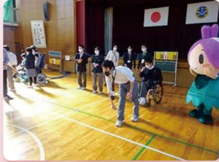
特別支援学校との交流会