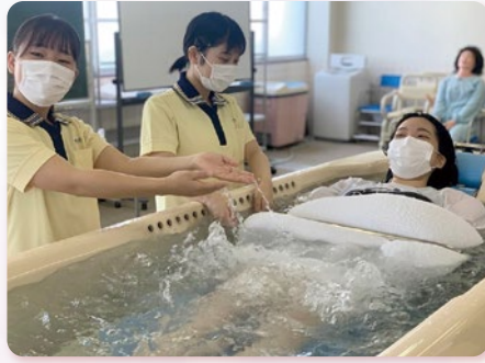
機械浴での入浴介護実習