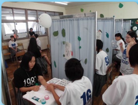
たかこう祭 (文化祭)