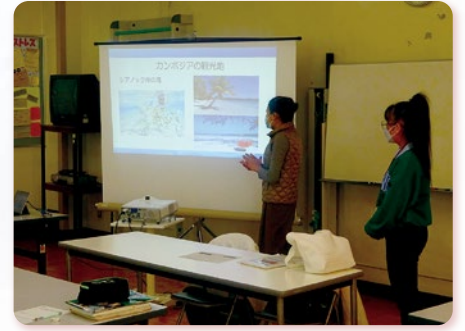
外国人介護職との交流会