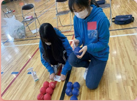
ボッチャの大会運営ボランティア