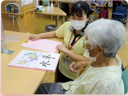
デイサービスでの介護実習